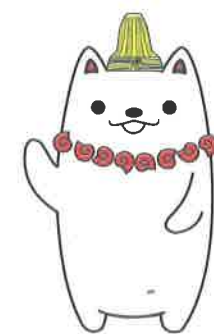
加曾利貝塚PR大使 かそりーぬ 加曾利貝塚は日本最大級の貝塚です。